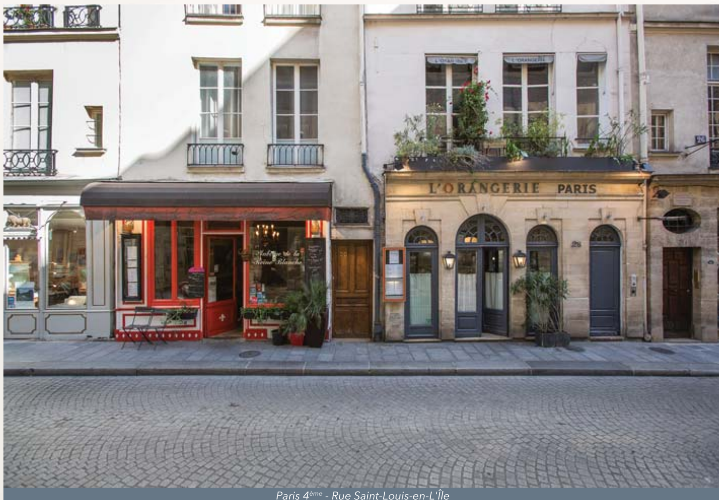
Paris 4 ème - Rue Saint-Louis-en-L'Île

Vous pouvez par ailleurs retrouver le bulletin trimestriel d'information, les statuts et la note d'information sur le site internet de la Société de Gestion ( www.sofidy.com ).