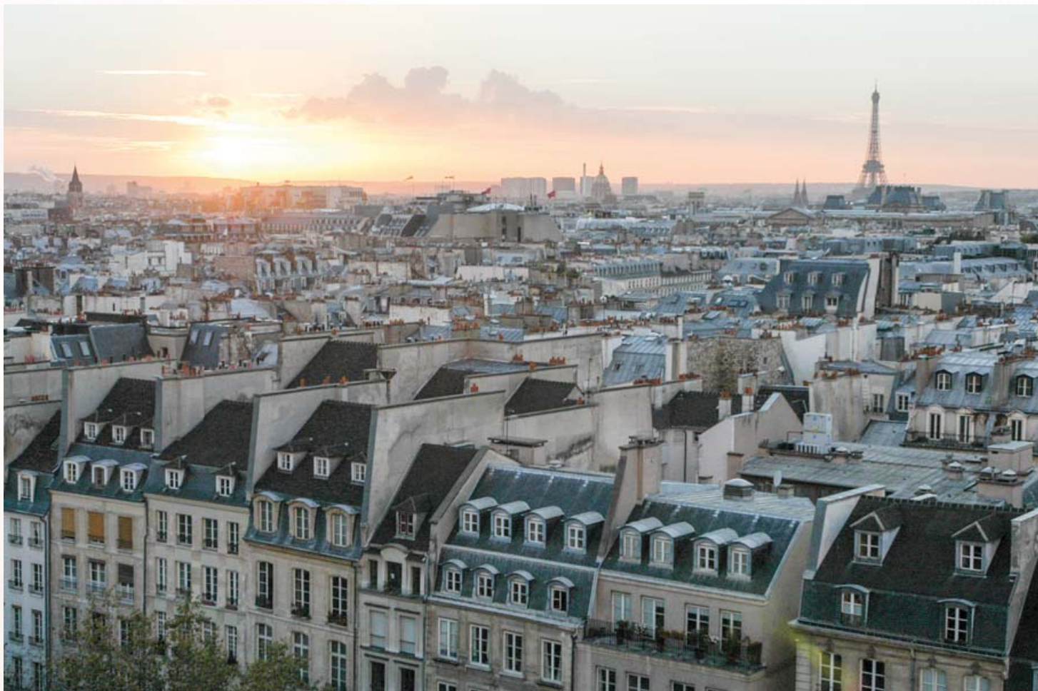
Photographie illustrant la cible d'investissement, à titre d'exemple, et ne préjugant pas des investissements futurs.