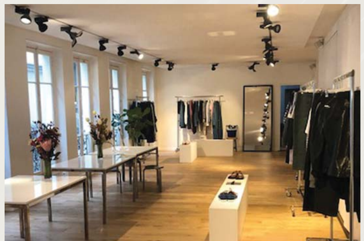
Paris 4 ème - Rue Sainte-Croix de la Bretonnerie

SOFIPRIME ayant été créée récemment, la Société de Gestion ne communique pas encore sur le taux de rendement interne (TRI) de la SCPI qui constitue un indicateur de performance sur le long terme.